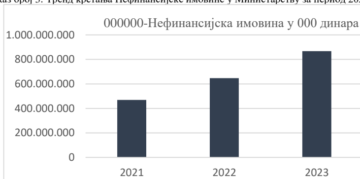
Графички приказ број 3: Тренд кретања Нефинансијске имовине у Министарству за период 2021–2023. година.

На графичком приказу дат је тренд кретања Нефинансијске имовине у Министарству за период 2021–2023. године.